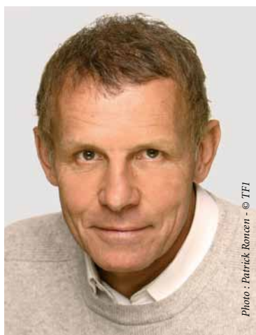
Patrick Poivre d'Arvor

Prix Interallié, Grand prix du roman de l'Académie française